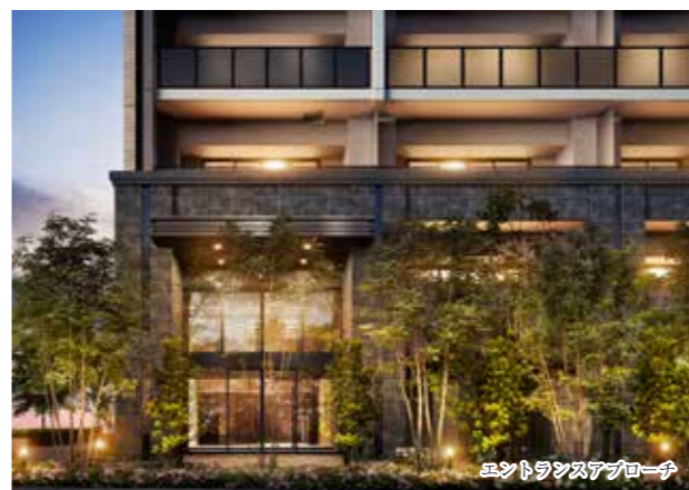
エントランスアプローチ