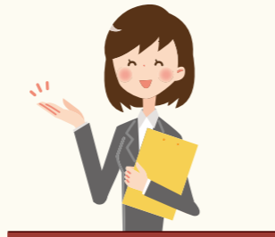
新築分譲マンションご購入の際はご来場時に長谷工の担当者をご指名ください